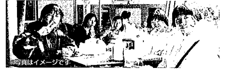
全学品の「海外国際交流プログラム」「国内自然体験活動プログラム」はNPO法人自然体験活動推進協議会の活動を応援しています。

後援：山形県教育委員会 山形県PTA連合会 山形県連合小学校長会 山形県中学校長会 山形県高等学校長会 推薦：全国学校用品株式会社 企画：山形教育用品株式会社 旅行企画・実施：(株)日本旅行関西企画旅行支店