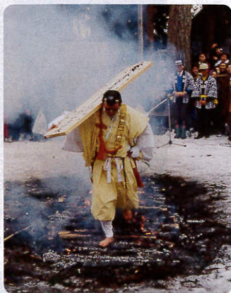
十七堂祭り「火渡り」