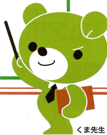
くま先生 (日本標準キャラクター)