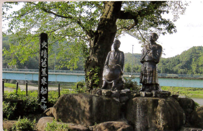
芭蕉と曾良の銅像