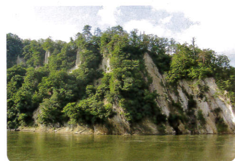
矢向神社と八向橋