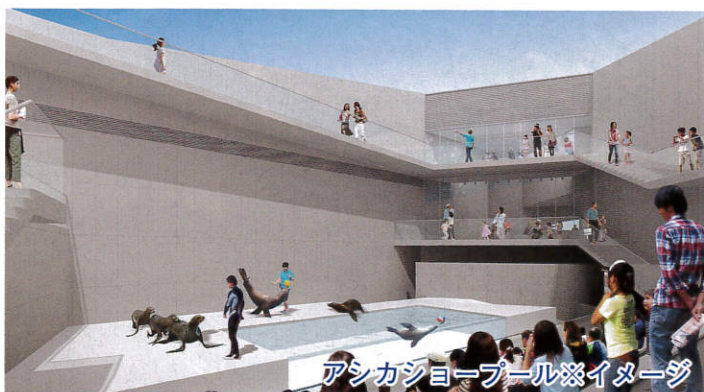
アシカショープール※イメージ