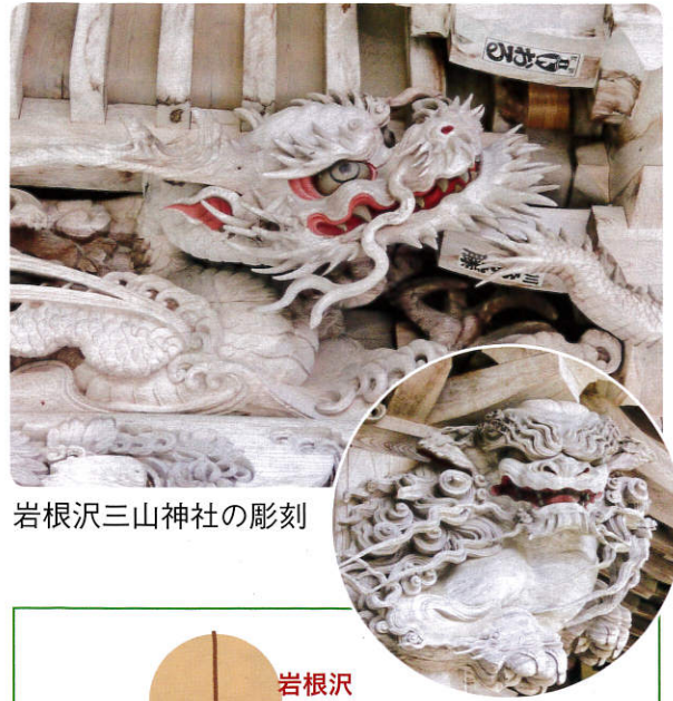
岩根沢三山神社の彫刻