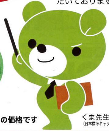
くま先生 (日本標準キャラクター)